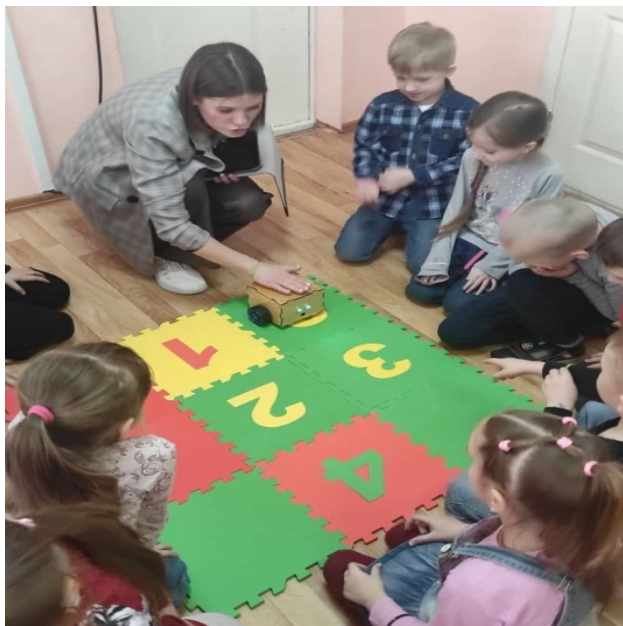
Занятие в подготовительной к школе группе «На космодроме»

Сетевая инновационная площадка по теме: «Апробация и внедрение основ алгоритмизации и программирования для дошкольников и младших школьников» - приказ от 21.06.2023 г. № П-187.