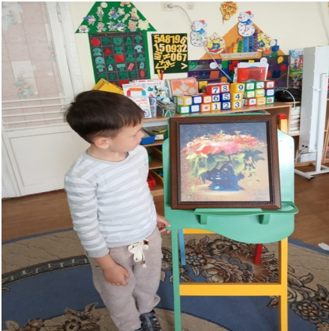
Занятие в подготовительной к школе группе «Букет»

Сетевая инновационная площадка по теме: «Организация Галереи в образовательной организации для решения задач художественно-эстетического и познавательного развития детей на основе интегративного подхода» - приказ от 27.02.2023 г. № 104.