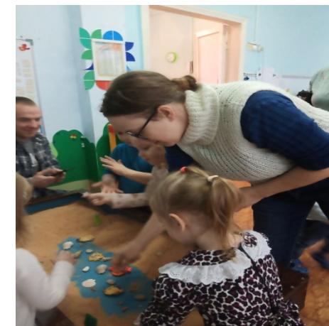
«Чудеса на песке»