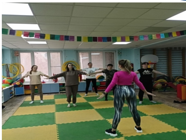
Занятие фитнес клуба «Супер-мама»