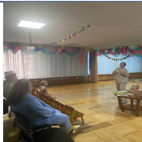
Занятие читательского клуба «Почитай-ка»