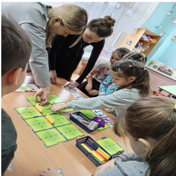
«Межгалактический турнир лабиринтов» - STIAM - лаборатория

Областная инновационная площадка по теме «Создание условий для совершенствования профессиональной компетентности педагогов ДООУ в сфере познавательно-исследовательской деятельности», приказ МО и ПО РО от 04.07.2024 г. № 680